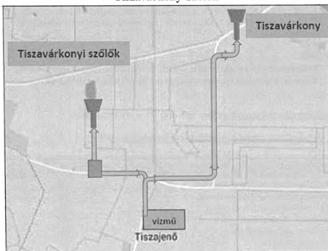
Víz útja Tiszajenőtől...

Tiszavárkony és Tiszavárkony-Szőlő vizét a Tiszajenőn épített új vízmű biztosítja. Mindkét helyen van víztorony, de rendeltetésszerű működésük kívánni valót hagy maga után.